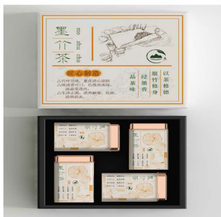
Figure 3. “Ink Bamboo Tea” product design drawing 图 3. “墨竹茶”产品设计图

墨竹茶产品(见图 3): 竹叶茶, 以竹叶为主要原料制作的一种茶。上王村竹林环村而生, 村里人应喜爱书法, 常有墨香, 日积月累, 渗透了茶叶, 使得当地的竹叶有着淡淡的墨香, 同时也因为上王村幽静清透的自然环境, 使得竹叶色泽清透, 口感更佳。竹叶重在清心凉肺, 其味清香可口, 其汤晶莹透亮, 具有清热解毒、化痰的功效。产品定位于人工栽培, 半机械化的养生品质饮品。宣传语为“品茶味, 浸墨香, 服竹修身, 以茶修德”。