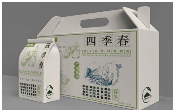
Figure 2. “Four Seasons Spring” product design drawing 图 2. “四季春”产品设计图

墨竹茶产品(见图 3): 竹叶茶, 以竹叶为主要原料制作的一种茶。上王村竹林环村而生, 村里人应喜爱书法, 常有墨香, 日积月累, 渗透了茶叶, 使得当地的竹叶有着淡淡的墨香, 同时也因为上王村幽静清透的自然环境, 使得竹叶色泽清透, 口感更佳。竹叶重在清心凉肺, 其味清香可口, 其汤晶莹透亮, 具有清热解毒、化痰的功效。产品定位于人工栽培, 半机械化的养生品质饮品。宣传语为“品茶味, 浸墨香, 服竹修身, 以茶修德”。