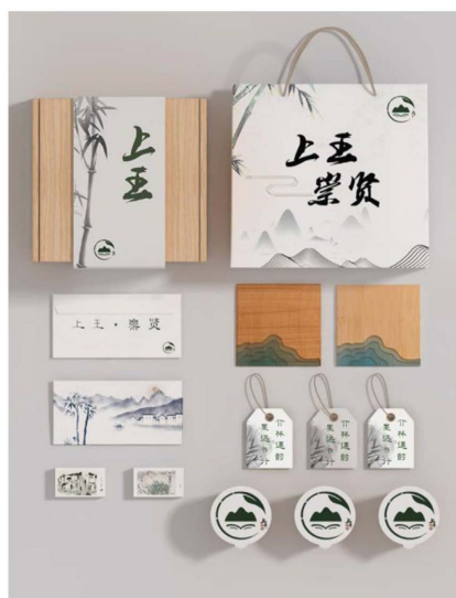
Figure 5. Design drawing of cultural and creative products