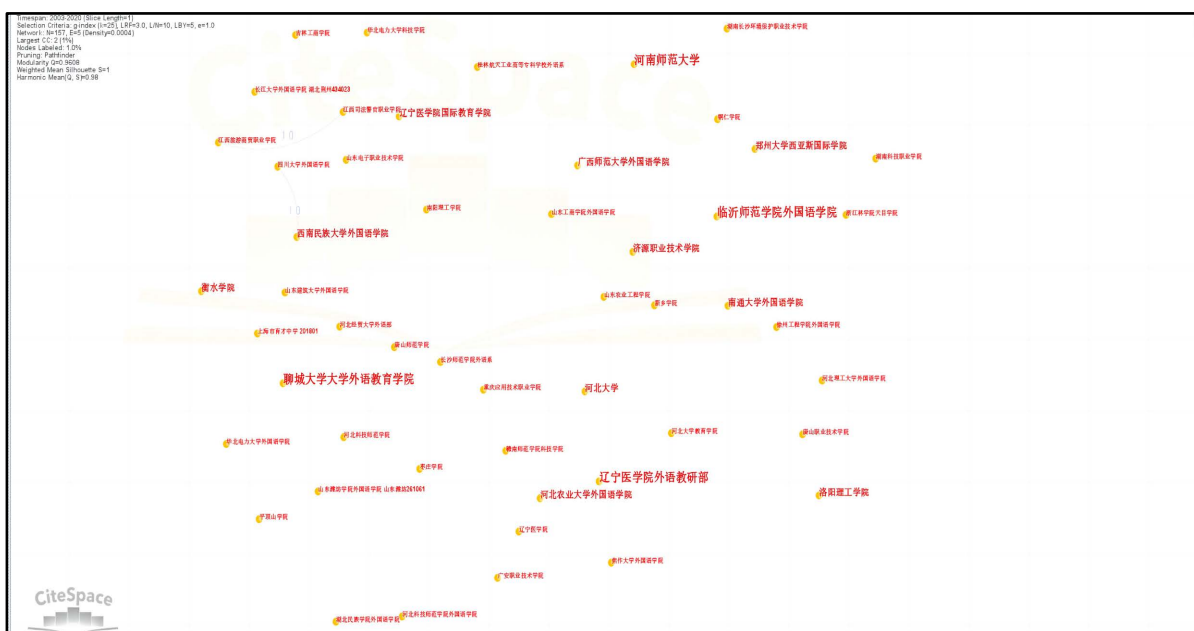
Figure 8. Research Institution co-present atlas