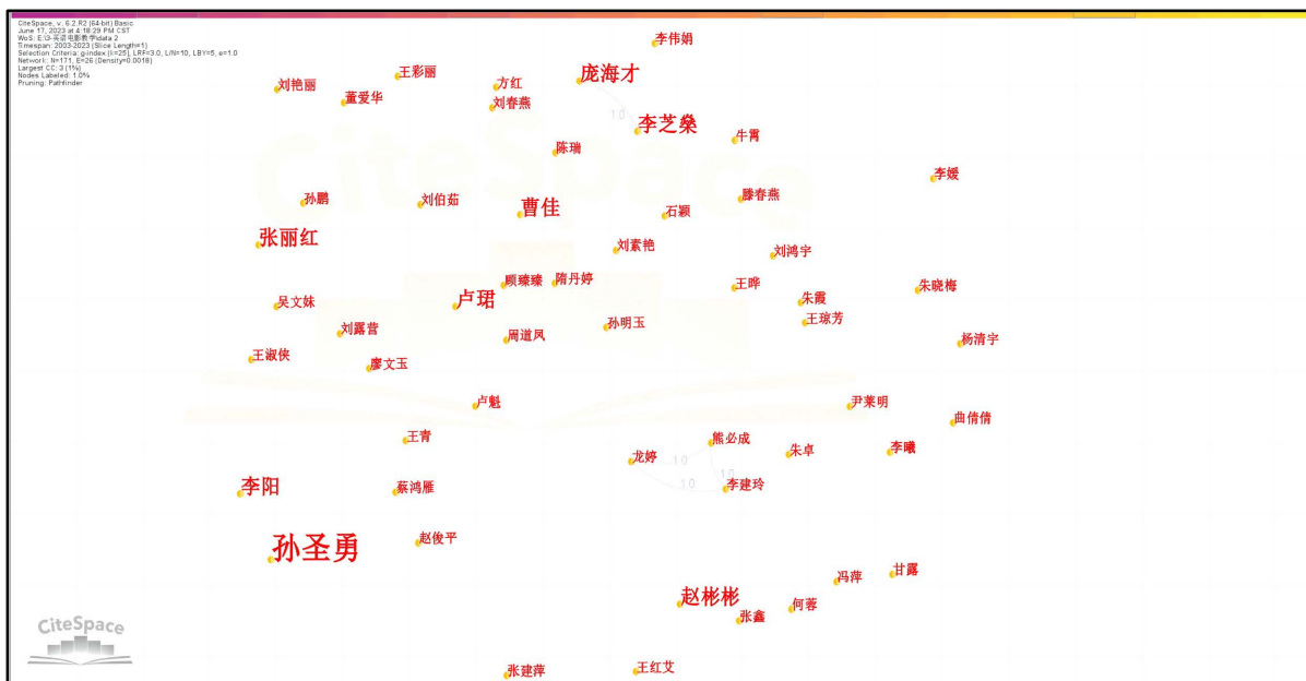
Figure 6. Author collinear map (partial)