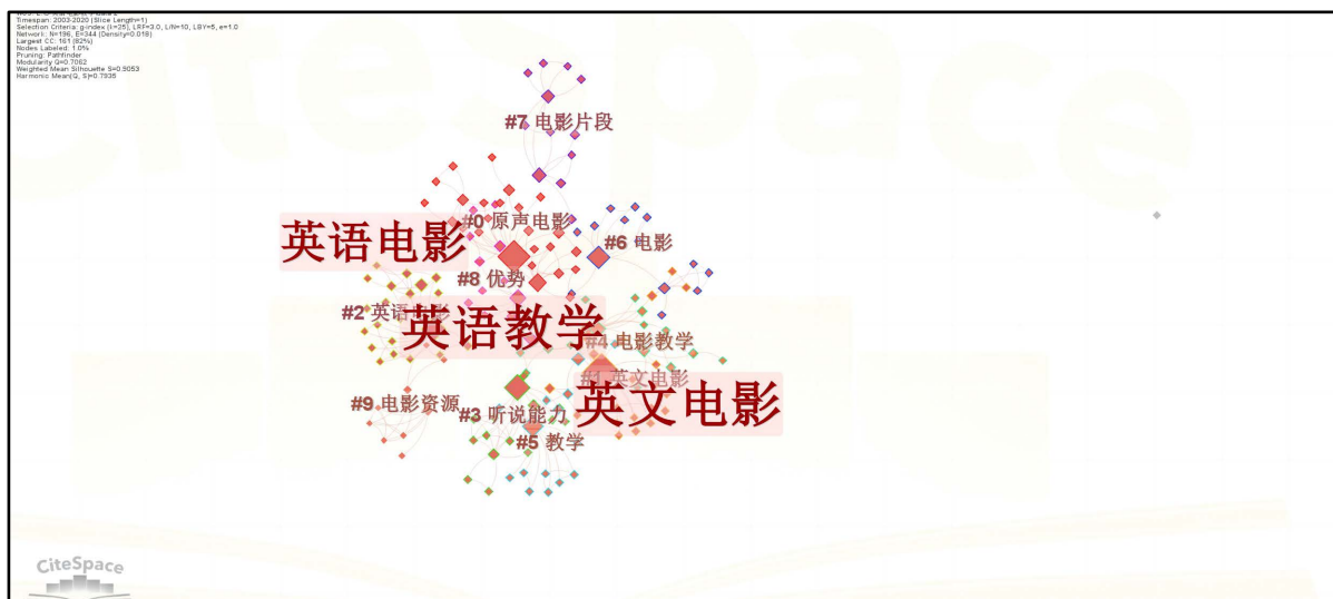
Figure 2. Keyword cluster map 图 2. 关键词聚类图谱

本文将所得数据的 Refworks 格式导入 CiteSpace6.2R2 软件中, 在软件主界面将时间设置为 2003~2020, 时间切片调整为 1 年, “Node Types” 栏中选中 “Keyword”, 得出关键词聚类图谱(图 2)高频关键词中心性和频次统计分布列表(图 3), 同时将 “ \gamma ” 值设为 “0” 生成关键词突现图谱(图 4)。