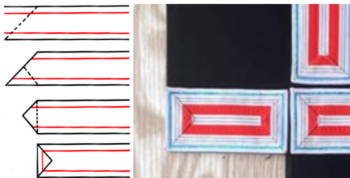
Figure 4. Schematic diagram of folding of decorative cutting pieces