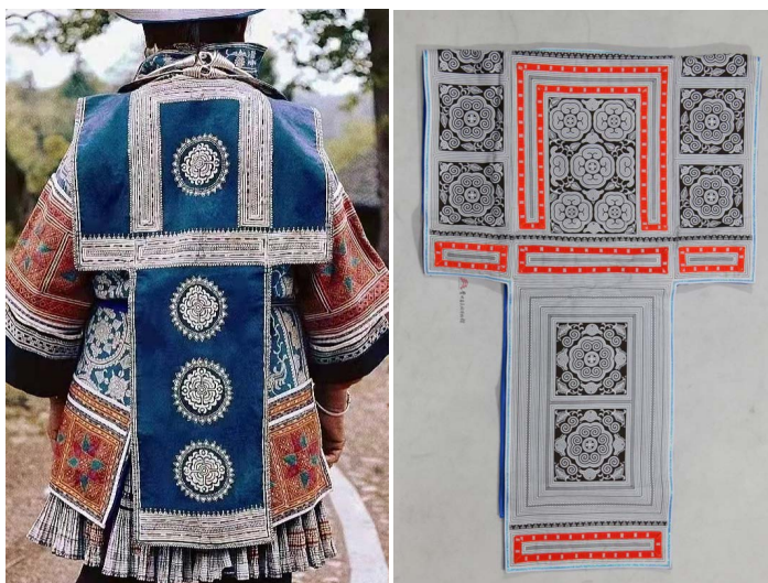
Figure 5. Batik pattern decorated the Guanshou dress

除用织带、绣片、蜡染片作为装饰外，部分贯首衣的衣身主体也会有相应装饰图案，主要是在贯首衣的背部点缀以蜡染纹样，一般为多个圆形或方形纹样组成(如图5)，多解释为太阳纹样，太阳纹在仡革家人的日常生活中极为常见，往往作为核心元素应用于盛装的图案设计中，其中各种自然物体紧密团结围绕在太阳内外，意为仡革家人对太阳的照耀下生活美好发展的期许。