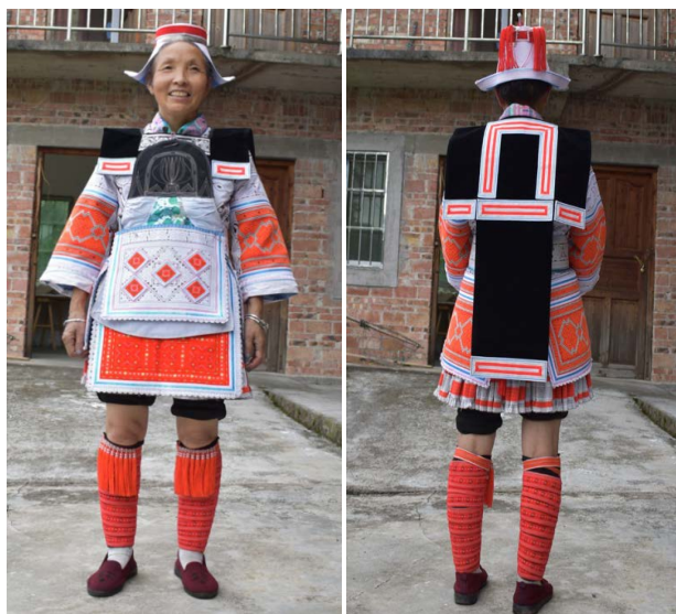
Figure 1. GeJia dressed in full dress

贯首衣是外层服饰品，主要特点为方布拼接、窄肩宽、窄衣身以及前短后长的造型。贯首衣主体结构由四块方布——前衣片、后衣片、左右肩片——拼接缝制，腋下不缝合，后衣片上端与肩部平齐，前衣片下落形成领口，前后衣片同宽。穿着时前衣片略过腰部，隐藏于配饰之下，只露出领部装饰嵌条，衣身以系带在两腰侧固定；后衣片完全露出，自然垂落，一般与里层的蜡花衣长度相等，在膝盖上 15 cm 左右，露出百褶裙的裙边；肩片略宽于人体肩宽，呈直角垫肩效果，折叠后前短后长，肩片前部分长至腋下，后部分长至手肘(如图 1)。