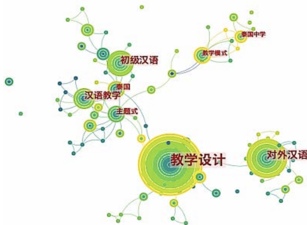
Figure 2. Aggregation Hotspot Map 图2. 聚合热点图

本文将108篇相关文献导入CiteSpace,并利用CiteSpace进行了数据的可视化处理,关键词(Keyword)为频谱统计类型,得出如下频谱图像,见图2。