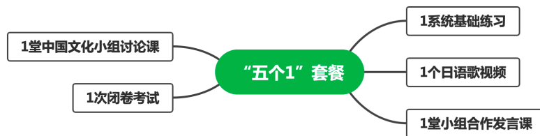
Figure 1. Learning outcomes of the “five ones” package

以学习效果为中心的教学模式,更好地引导学生建构属于自己的知识体系,采用项目式学习等多种方式,引导学生自主学习,在学习的过程中挖掘自己的学习潜力,端正自己的学习态度,找到适合自己的学习方法。混合式教学模式,同时将所有学习成果具象化,由教学目标明确学习成果,学习成果可测评并且可转换成平时成绩。本课程的学习成果,以“五个 1”的套餐形式(见图 1),全方位、全过程呈现,具体包括:1 系统基础练习(单词打卡,朗读打卡,语法测试),1 个日语歌视频、1 堂小组合作发言课、1 堂中国文化小组讨论课,1 次闭卷考试。这些学习成果是多元的、分层的、具体的和可测评的。